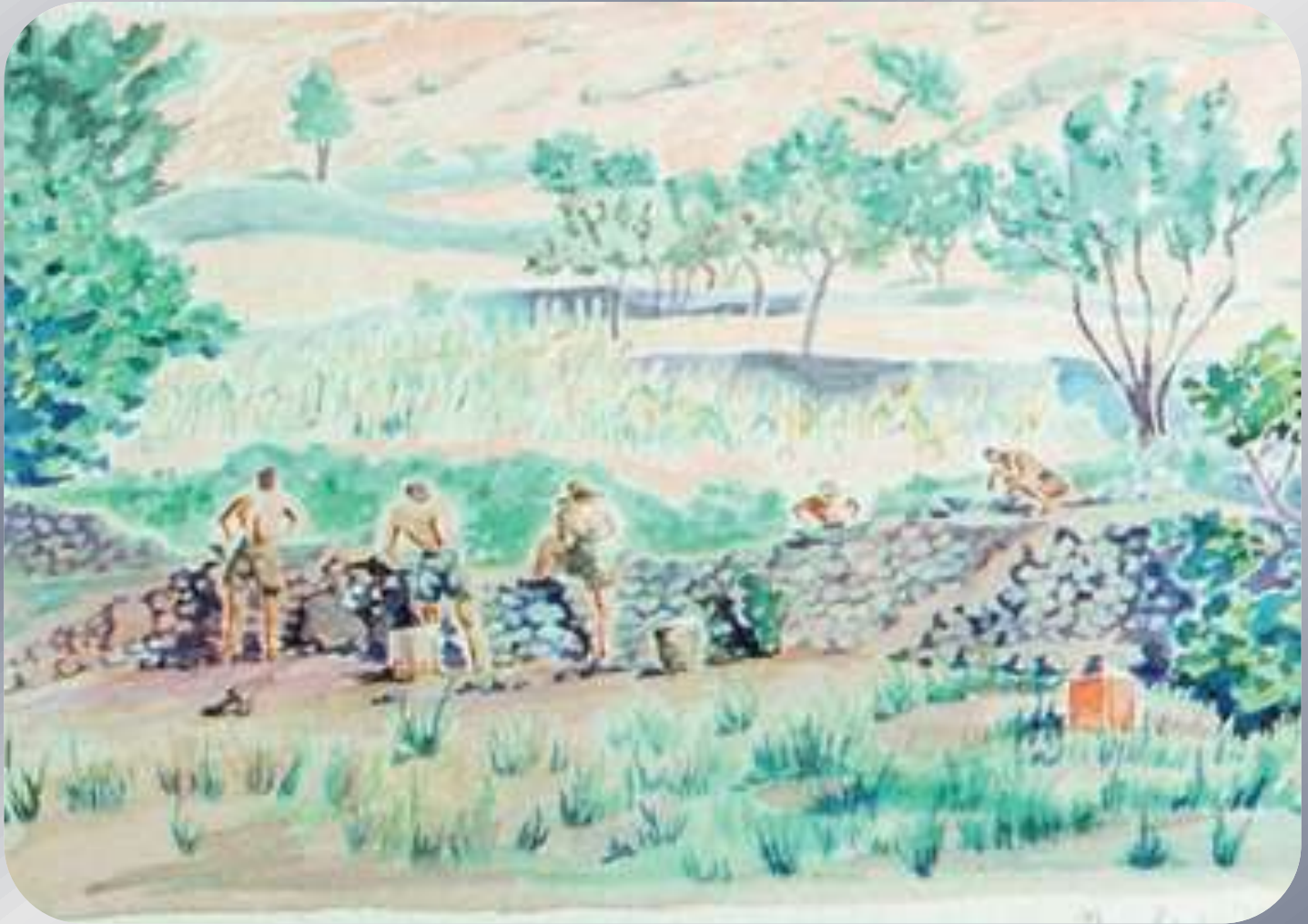
Απαγγελία « οι γειτονιές του κόσμου »