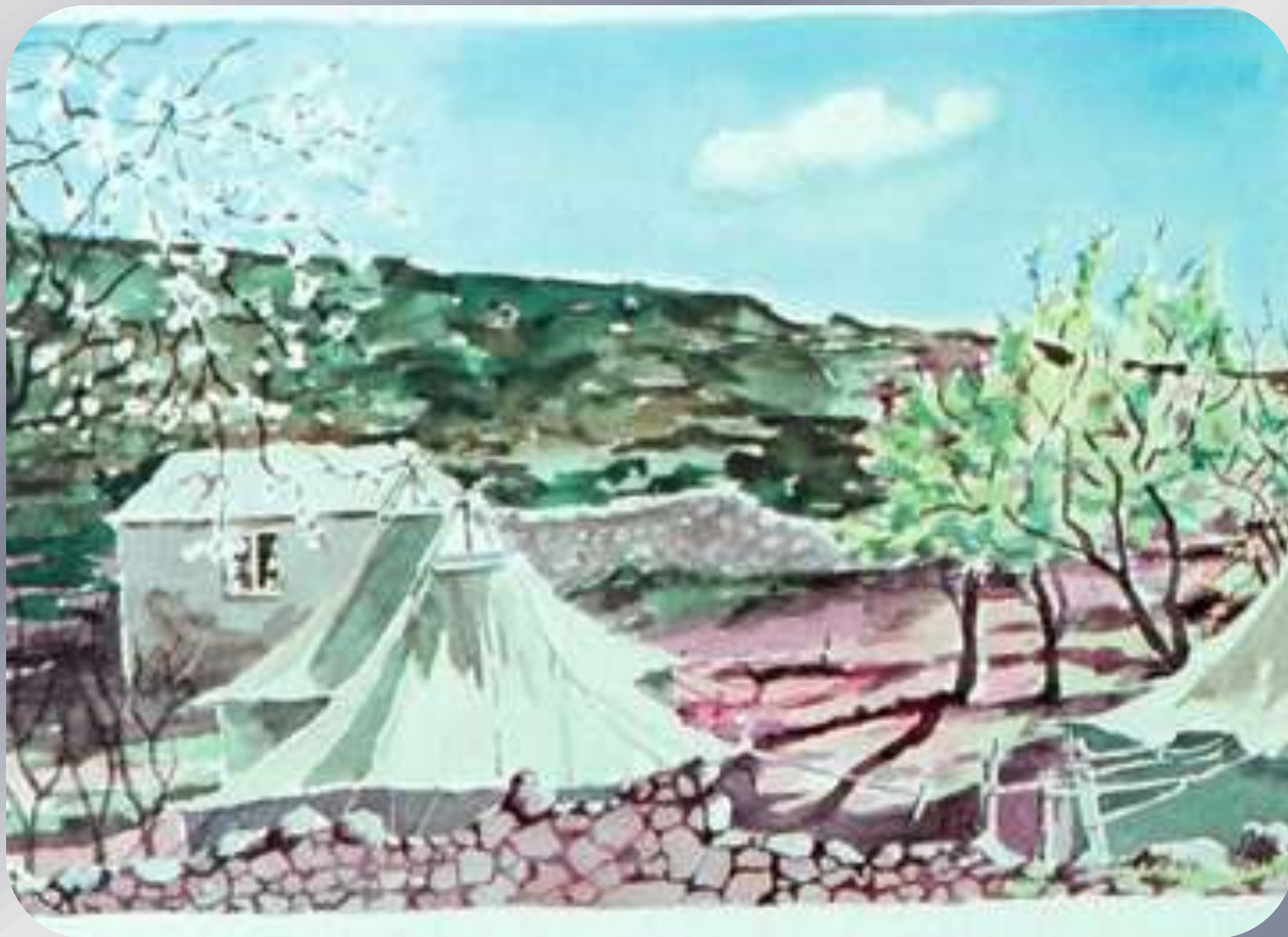
Απαγγελία « Ημερολόγια εξορίας »