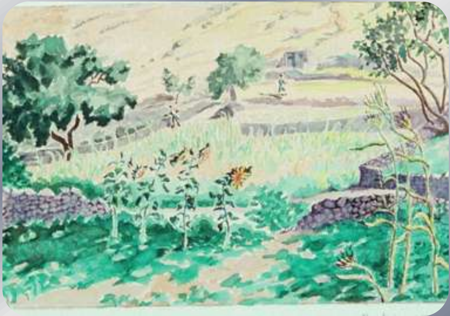
Απαγγελία « Αγρύπνια »